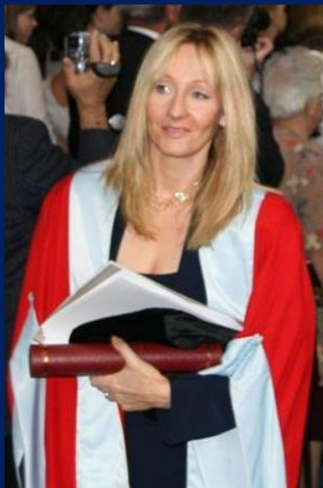
Joanne Rowling 2006 nach dem Erhalt eines Ehrentitels von der University of Aberdeen.

und der Stein der Weisen“ im Jahr 1995 vollendete. Das Werk wurde von mehreren Verlagen abgelehnt, aber schließlich doch von einem Verlag angenommen, der es bereits einmal abgelehnt hatte. Rowling bekam jedoch die Empfehlung, sich wieder eine Stelle zu suchen, da man von Kinderbüchern allein nicht den Lebensunterhalt bestreiten könne. Das Buch „Harry Potter und der Stein der Weisen“ wurde mit einer Startauflage von lediglich 500 Stück gedruckt. Rowling schrieb jedoch fleißig weiter an den Fortsetzungsbänden. Bereits die ersten beiden Bände verkauften sich gut, aber erst nach Erscheinen des dritten Bandes wurde die Weltöffentlichkeit endgültig auf die Harry-Potter-Bücher von Rowling aufmerksam. Rowling ist unter den Schriftstellern der Weltgeschichte die erste, die mit ihren Werken eine Milliarde US-Dollar verdiente.