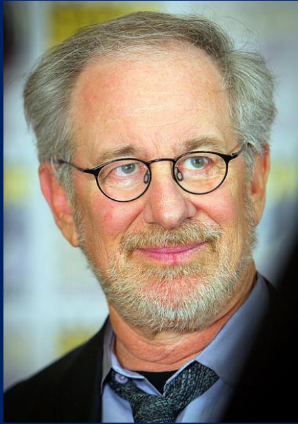
Steven Spielberg 2011.

sich bereit, das Drehbuch zu produzieren. Nachdem der Film schließlich Jahre später produziert wurde, wurde er ein Welterfolg und spielte zusammen mit zwei Fortsetzungs-Filmen insgesamt über 957 Millionen US-Dollar ein.